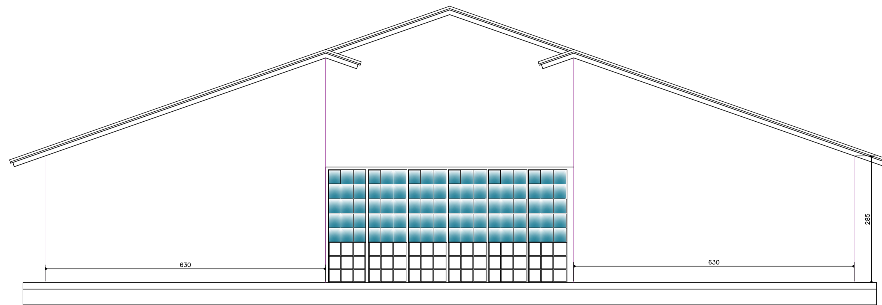
ELEVAÇÃO FRONTAL Escala 1/50