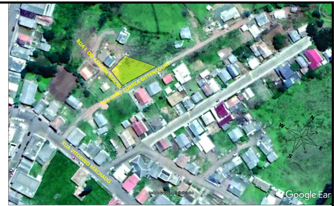
Planta Situação Área Lote: 658,62 m 2