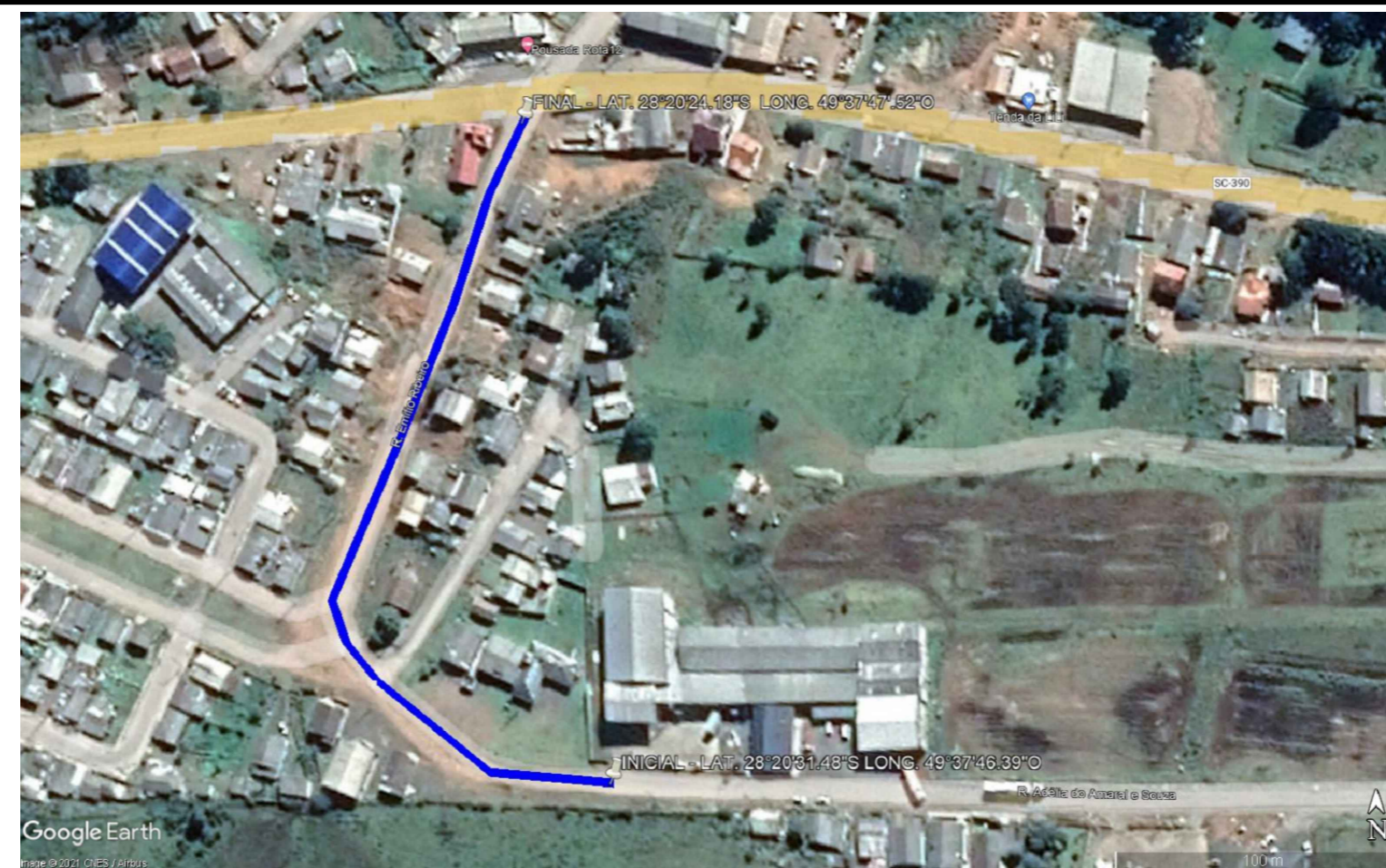
LOCALIZAÇÃO DA RUA