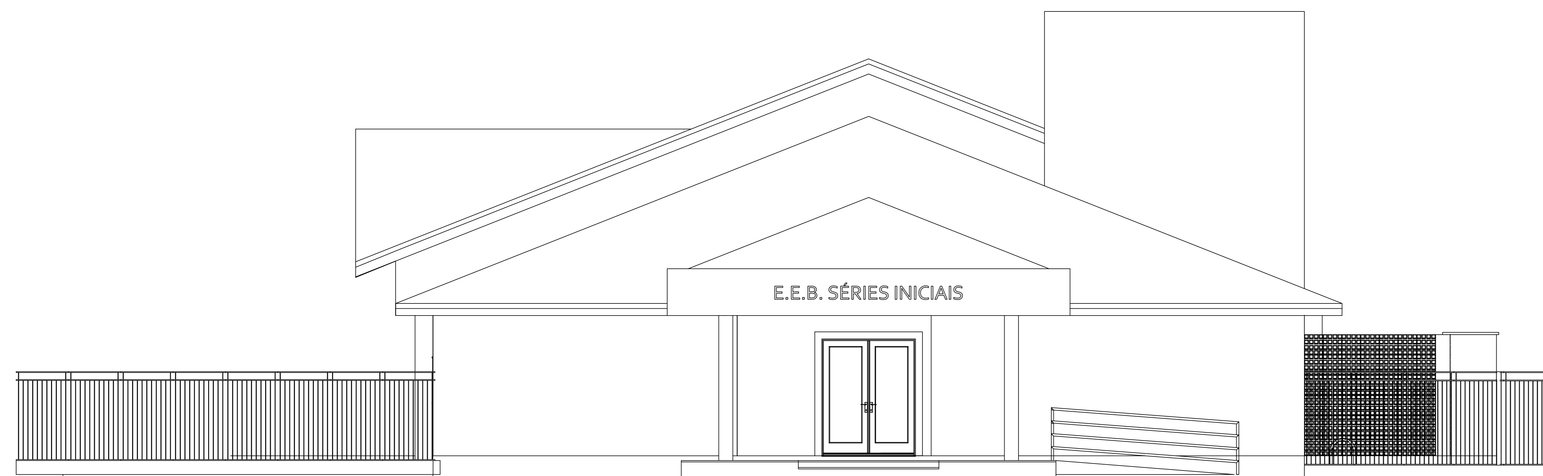
VISTA FRONTAL área: 1241,83m 2 escala: 1/50