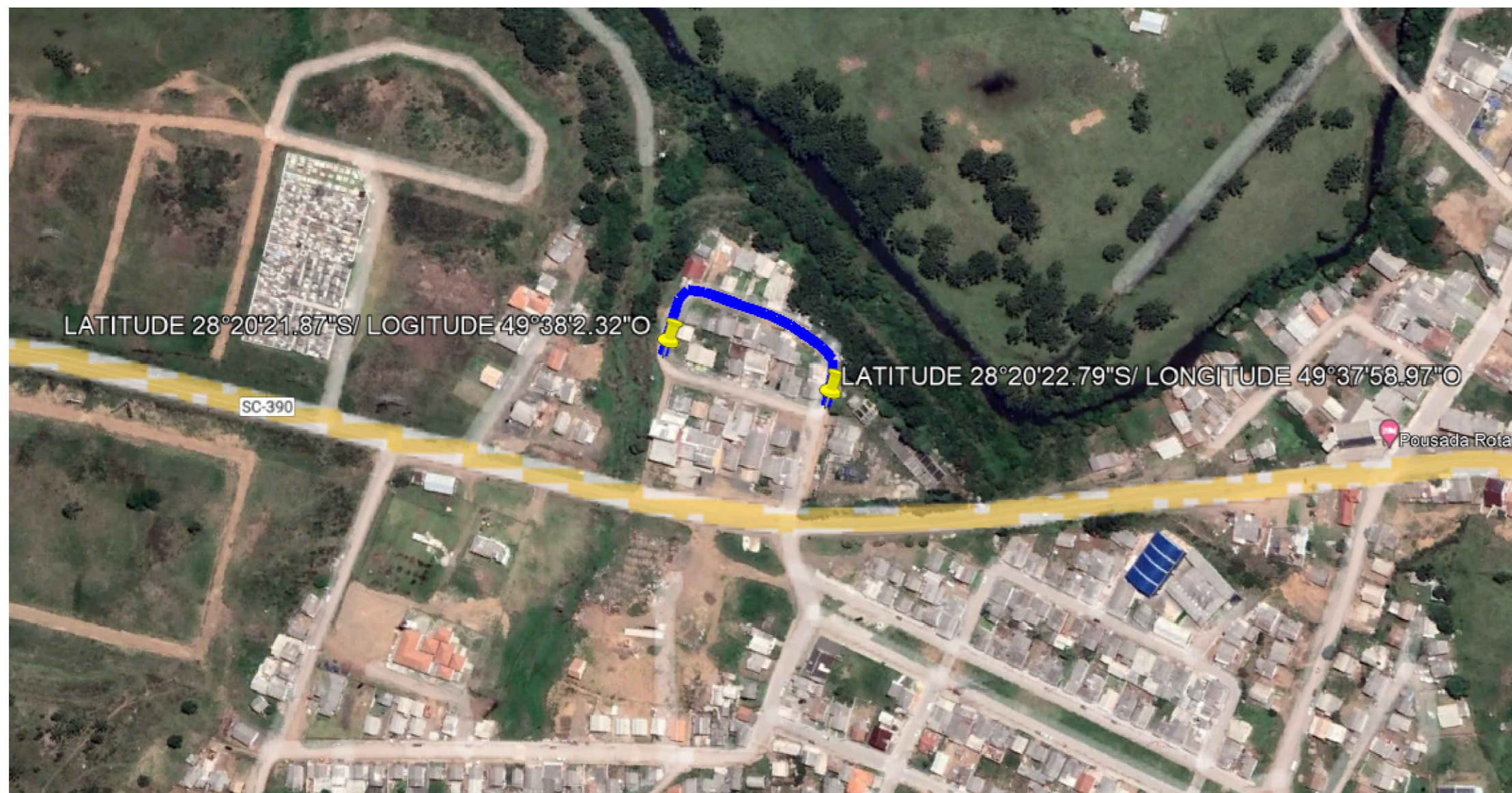
LOCALIZAÇÃO DA OBRA