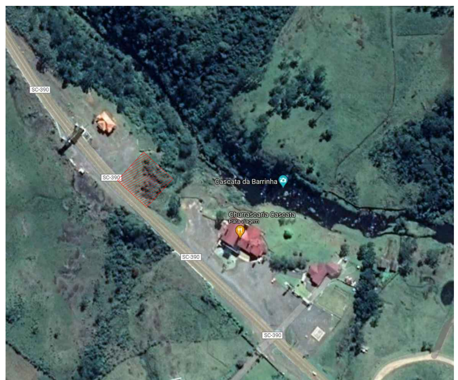
LOCALIZAÇÃO SEM ESCALA