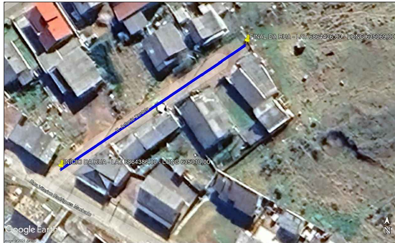
LOCALIZAÇÃO DA RUA ANTONIO CORDELLA